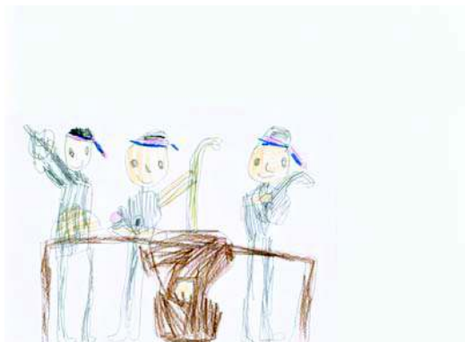
„Muzikaši na zagorskoj svadbi“ Martin, 6 g. 3 mj.

Cilj programa je doprinijeti da dijete izraste u odraslu osobu koja voli, poznaje i čuva svoj kulturni identitet i tradiciju, te koja s radošću upoznaje i poštuje tradiciju drugih.